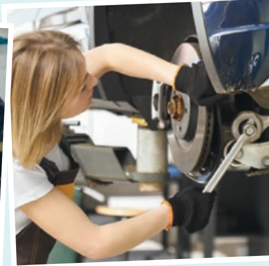
Reparatur des Fahrwerks