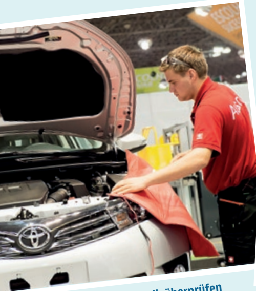
Funktion der Elektronik überprüfen